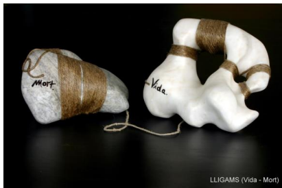
LLIGAMS (Vida - Mort)