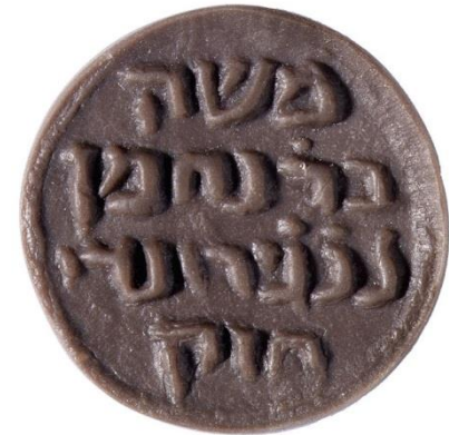
Segell personal de Bonastruc ça Porta trobat prop d'Acra (Palestina). Se'n pot veure una còpia al Museu d'Història dels Jueus de Girona.

La intenció és consolidar els premis i celebrar-los anualment el mes de maig, coincidint amb la jornada de portes obertes que el COMG celebra anualment en el context d'un certamen molt arrelat al territori que reflecteix l'esclat de la primavera, el Girona Temps de Flors.