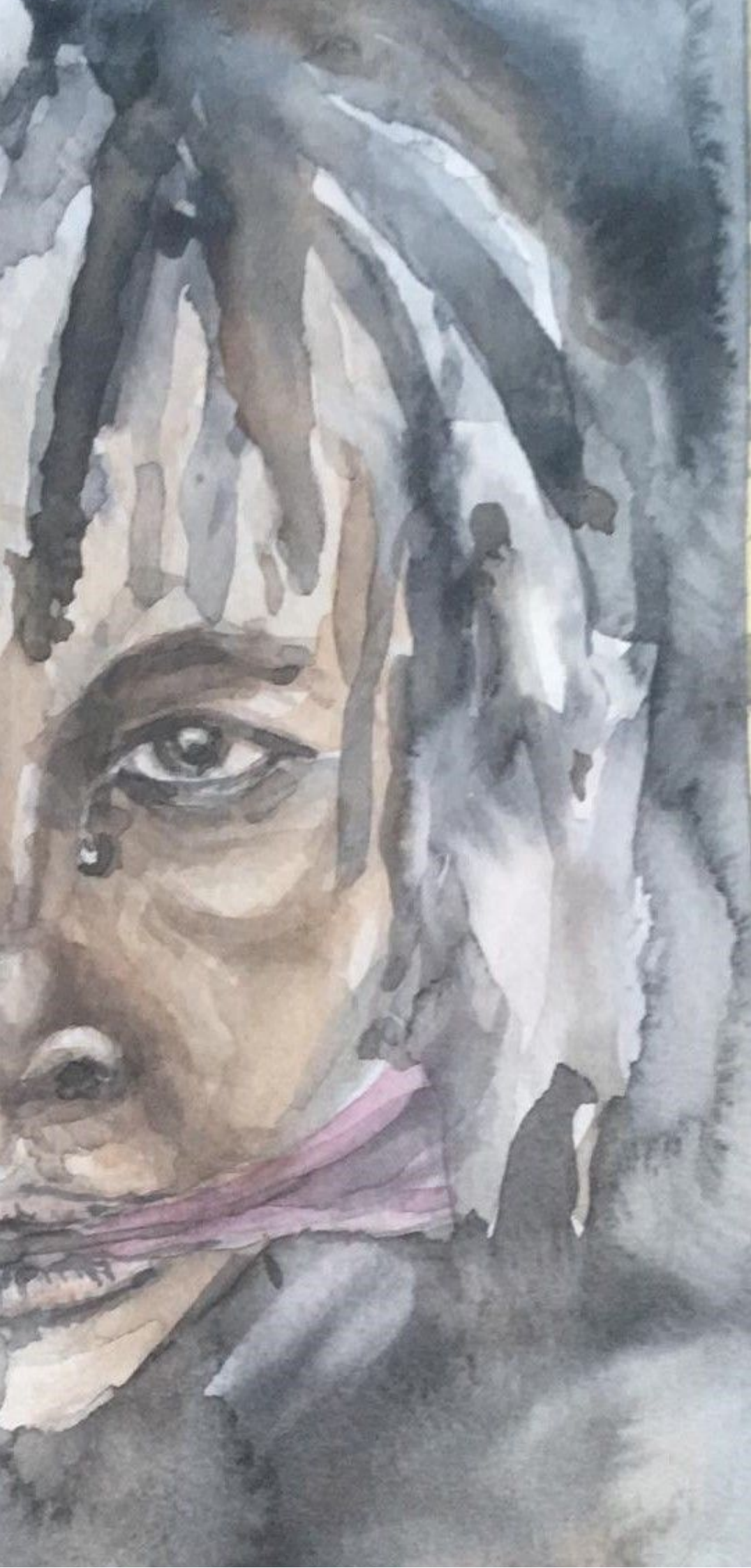
Dibuix d'Elsa Batallé